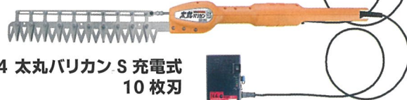
N-974 太丸バリカン S 充電式 10枚刃