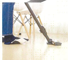
家電の電源延長用として