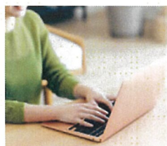
PC作業時の電源として