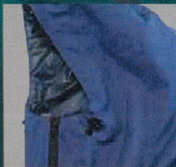
アジャスター付フード