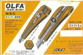
1969年発売当時の広告(左:300型)