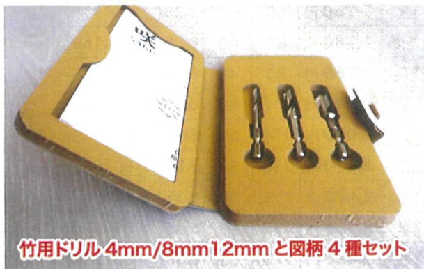
竹用ドリル 4mm/8mm12mm と図柄 4 種セット