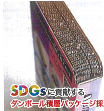
SDGS に貢献する ダンボール積層パッケージ採用