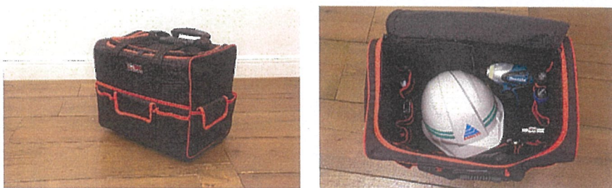
ローリングキャリーバッグ DT-RCB-ST