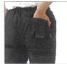
右後ろフラップ ポケット