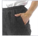
ポケット裏 フリース素材使用