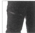
右膝止水ファスナー ポケット