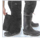
大型調節 フラップテープ