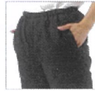
両サイドポケット